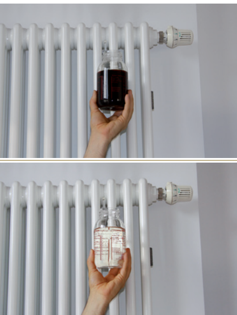
HEIZUNGSWASSER OHNE UMH HEIZUNGSWASSER MIT UMH

Gerne möchten wir über die Erfahrung mit den UMH-Heat-Geräten, welche wir in unsere zwei großen Häuser im Frühjahr 2011 eingebaut haben, berichten. Kürzlich wurden wiederum Wasserproben aus dem Heizungssystem entnommen. Wie schon bei früheren Inspektionen zeigte sich, dass das Heizungswasser völlig klar und schmutzfrei ist.